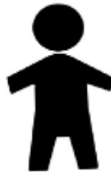
圖五 兒童馬桶或兒童小便器