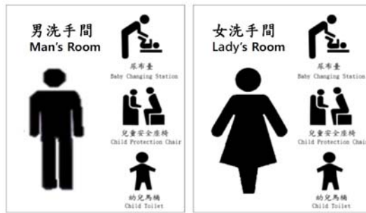
圖二 設備種類標誌