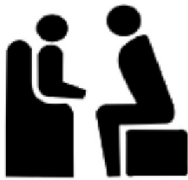
圖四 兒童安全座椅