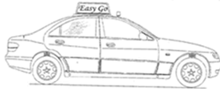
計程車車頂廣告看板三視尺寸圖